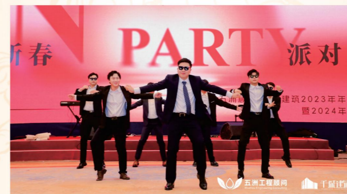
▲ 工管公司、监理公司联合选送节目《科目三》