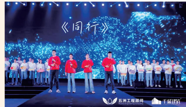
▲ 青年发展联盟、星洲计划成员合唱《同行》