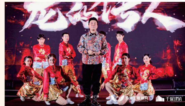
▲ 唱跳节目《龙的传人》