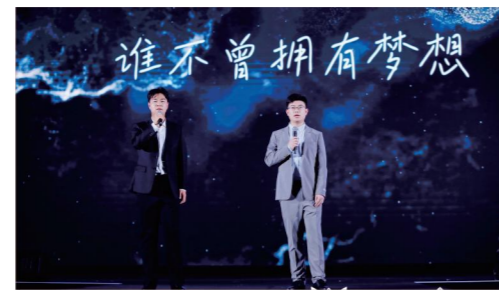
▲ 强鹰计划21期学员演唱《谁不曾拥有梦想》