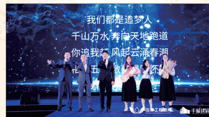
▲ 可持续发展中心选送节目《五洲造价人 勇敢追梦人》