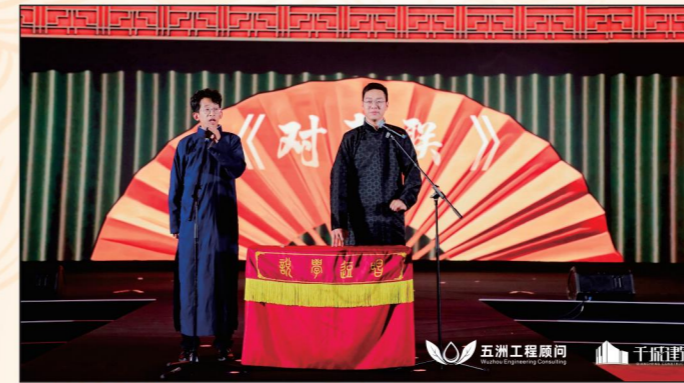
▲ 工管公司选送节目《对春联》