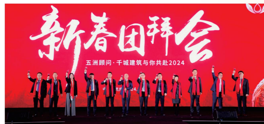
▲ 全体高管致祝酒词