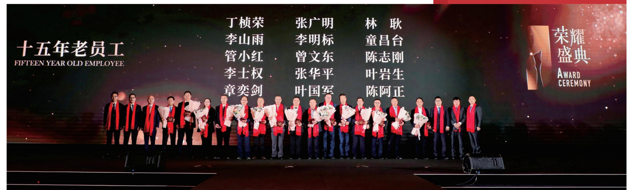
▲ 集团高管为15年老员工颁奖