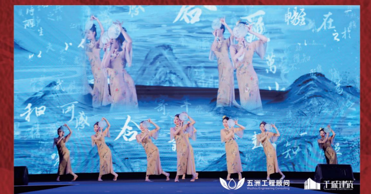
▲ 华南公司选送节目《风月》