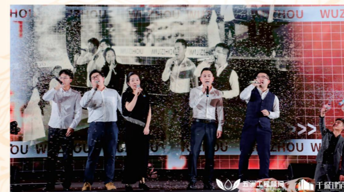
▲ 千城建筑选送节目《繁花》