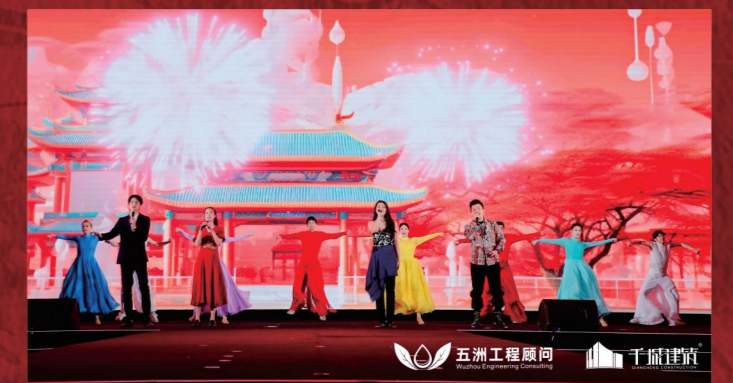
▲ 五洲党委选送节目《相亲相爱》