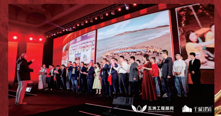
▲ 全体高管与演职人员合唱企业歌《五洲人》