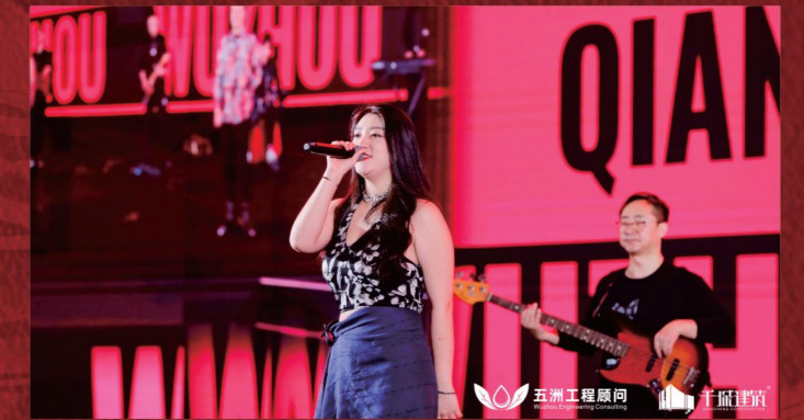
▲ 乐队串烧《last dance》《日不落》《你要跳舞吗》