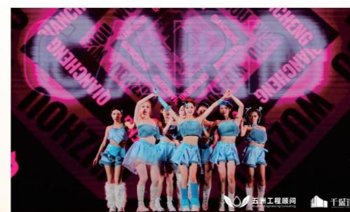
▲ 舞蹈节目《Queen card》